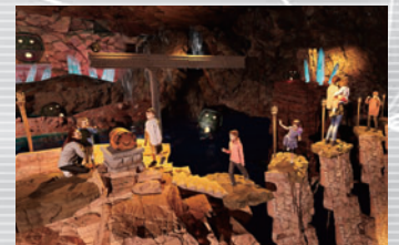
CG映像合成の体験型アトラクション ~グンマー帝国 地底洞窟からの脱出~