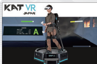
歩行型VR機器を活用した 火災避難訓練