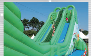
エアージップライン体験