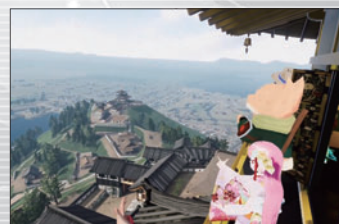
安土城メタバースツアー