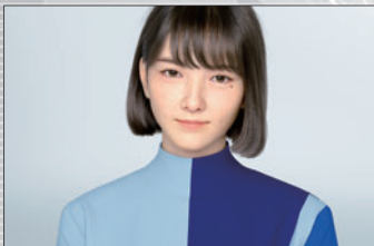
ヴァーチャルヒューマン「Sayal」