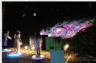
光と音の体験型 プロジェクションマッピング