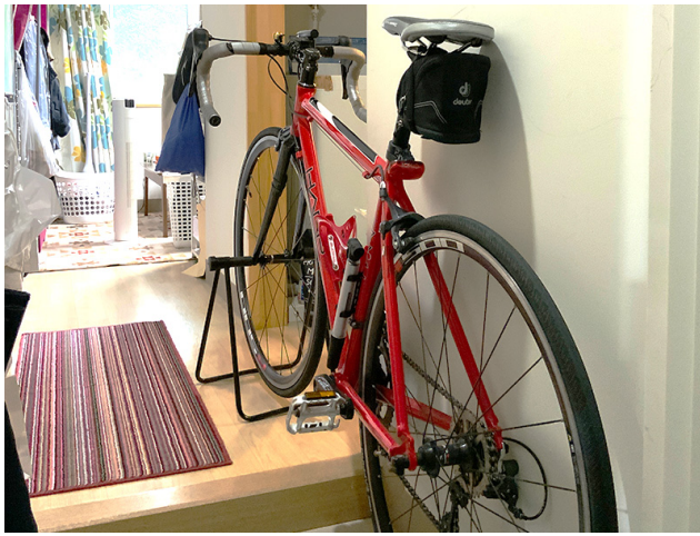
大学までは自転車で通学しています

勉強する場所(机)と休む場所(ベッド)、ご飯を食べる場所(テーブル)の区切れ目をきちんと作り、「ながら」になったり、だらだらしないよう切り替えをきちんとできるようにしている点です。