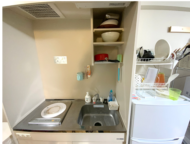
ほぼ毎日自炊しています