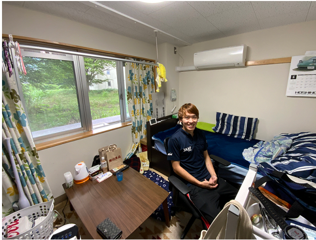
窓の外は緑豊かな眺め