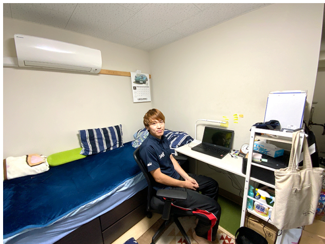
リニューアルしたので真新しい寮です