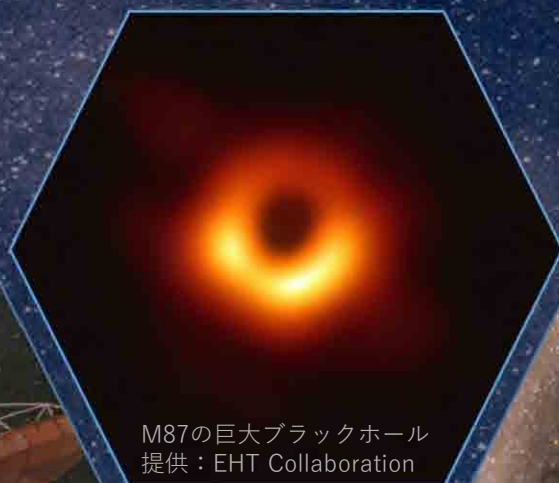
M87の巨大ブラックホール