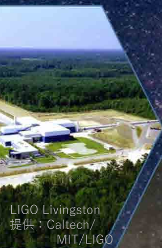
LIGO Livingston