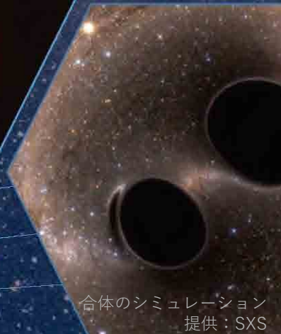
合体のシミュレーション